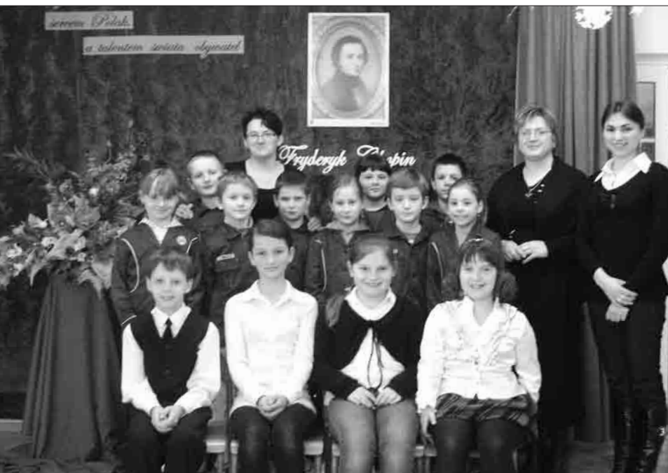
Klasa 3 – twórcy lirycznego koncertu i autorki projektu chopinowskiego