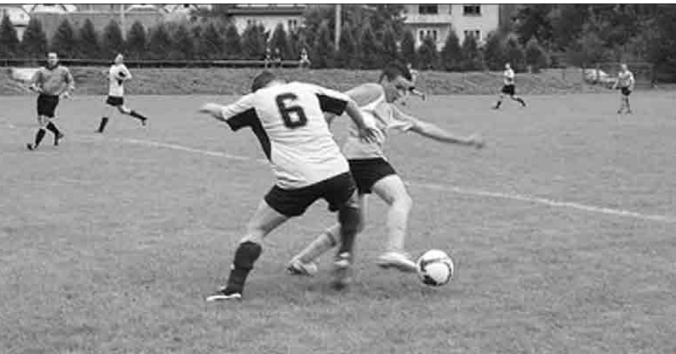
FOT. ŚNIEŻNICA FUTBOLOWOPI

W niedzielę 27 czerwca br. rozegrano ostatnią kolejkę spotkań limanowskiej klasy „A” i „B” seniorów. Liga zakończyła zmagania w sezonie 2009/10, po ponad 10 miesiącach ciężkich bojów. Szczególnie tegoroczna deszczowa wiosna, dała się bardzo mocno we znaki naszym klubom. Jaki to był sezon?