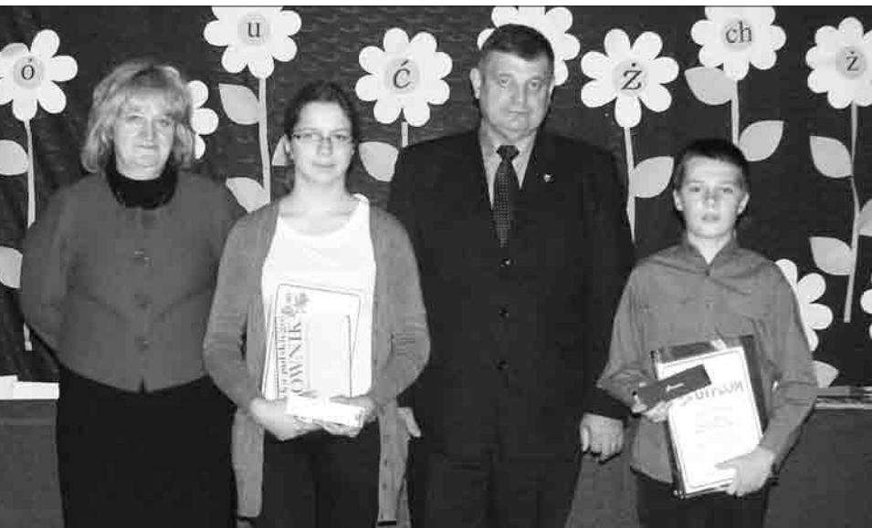
Laureaci konkursu z władzami gminy