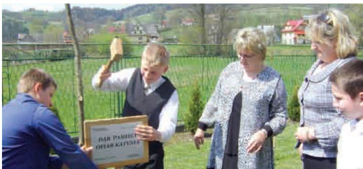
Katyń 1940 – Smoleńsk 2010 – str. 36