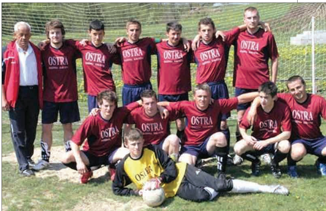
Ostra Olszówka – Raba Ni na zajęła 3. miejsce w rozgrywkach klasy „B”