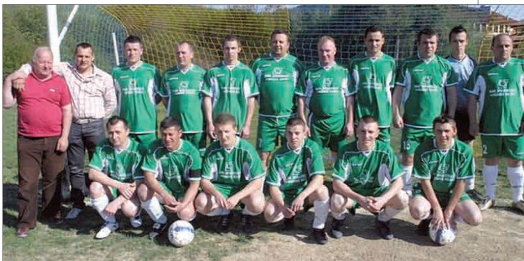
Drużyna Witowa w rozgrywkach „A” klasy zajęła 6 miejsce