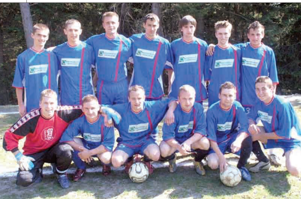
Zenit Kasinka Mała skutecznie obronił miejsce w klasie „A”