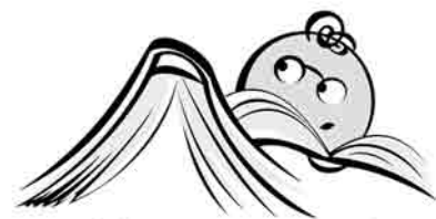
z mojej gminy na wyżyny

poprzez podniesienie ich poziomu wiedzy i umiejętności. Kształtowane w ten sposób odpowiednie postawy, pomogą w lepszym przygotowaniu się do następnego etapu edukacji, a w przyszłości podniosą ich szansę na rynku pracy. Dzięki dodatkowym zajęciom dzieci rozwijają swoją wiedzę i umiejętności oraz zainteresowania. Ważne jest także podniesienie motywacji do nauki i zwiększenie pewności siebie. Grupę docelową w projekcie stanowią uczniowie szkół podstawowych. Zakres wsparcia przeznaczony jest na zajęcia: kształcenie zintegrowane (kl. 1-3), języka polskiego (kl. 4-6), matematyki (kl. 4-6), logopedyczne (kl. 1-3), dla uczniów z dysgrafią i dysleksją (kl. 4-6), indywidualne konsultacje pedagogiczno-psychologiczne (kl. 1-6) oraz zajęcia z zakresu ICT-Internet, mediów, przedsiębiorczości, ekologii, języka angielskiego, jak również warsztaty edukacyjno-zawodowe pt. „Moja pasja-moja szansa, gimnazjum – co wtedy?”. Ponadto w ramach każdego działania uczniowie zostali wyposażeni