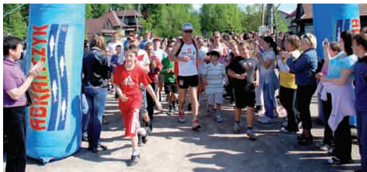
Oddał hołd Justynie Kowalczyk – str. 52