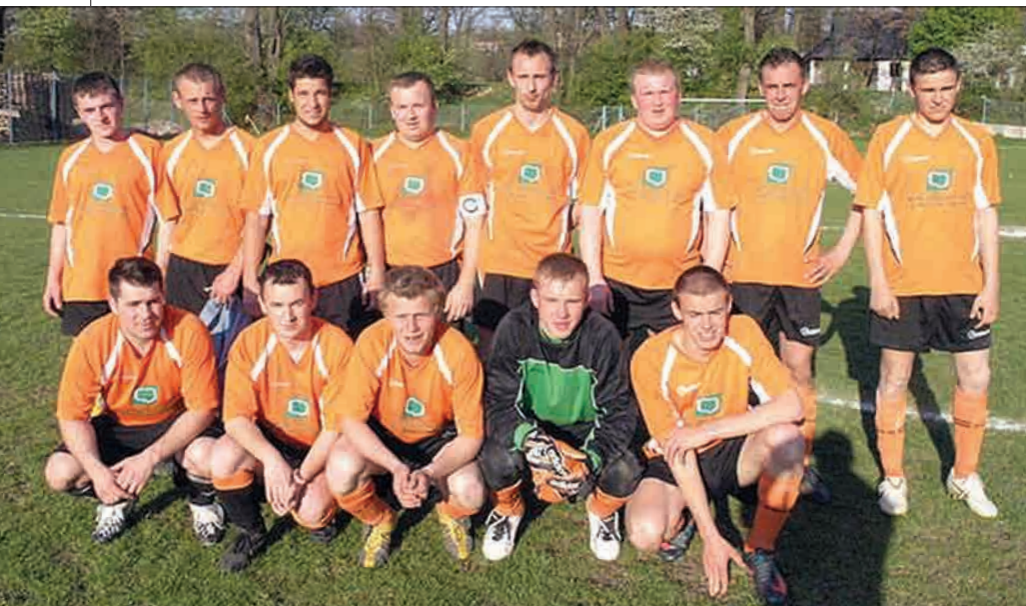
nie nica Kasina Wielka po roku przerwy awansowała do klasy „A”